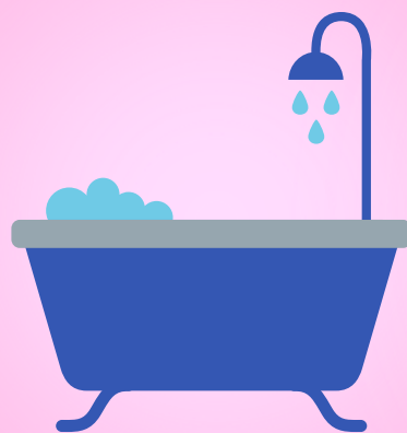
Kupanje i plivanje