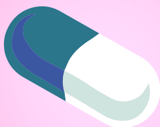
Čepići protiv bolova