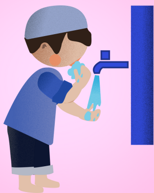
Ispiranje usta i nosa