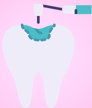
Popravljanje i vađenje zuba